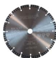
Referencia 71621014 EAN-Code 8436028500697