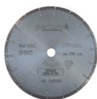
Referencia 71621018 EAN-Code 8436028500734