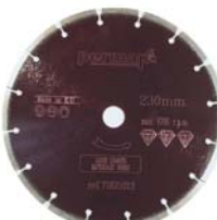
Referencia 71621012 EAN-Code 8436028500673