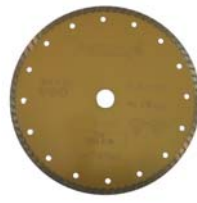
Referencia 71621006 EAN-Code 8436028500611