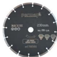
Referencia 71621010 EAN-Code 8436028500659