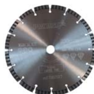
Referencia 71621015 EAN-Code 8436028500703