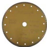
Referencia 71621007 EAN-Code 8436028500628